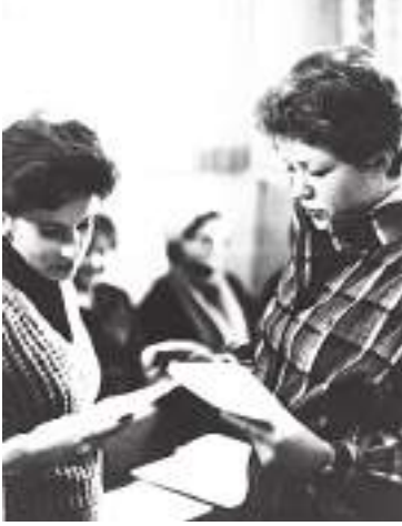
Комсомольцы ПШО «Орёл» сдают Ленинский зачёт. /